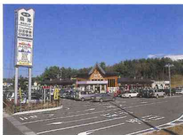
道の駅鳥海「ふらっと」

□マイカーの場合 秋田 → 国道7号 → 遊佐町吹浦 酒田 → 国道7号 → 遊佐町吹浦 酒田みなとICから車で15分 □JR利用の場合 遊佐駅 (0234)72-2036 羽越本線 吹浦駅下車 → 徒歩10分 羽越本線 遊佐駅下車 → 車10分