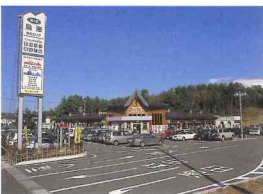
道の駅鳥海「ふらっと」

□マイカーの場合 秋田 → 国道7号 → 遊佐町吹浦 酒田 → 国道7号 → 遊佐町吹浦 酒田みなとICから車で15分 □JR利用の場合 遊佐駅 (0234)72-2036 羽越本線 吹浦駅下車 → 徒歩10分 羽越本線 遊佐駅下車 → 車10分