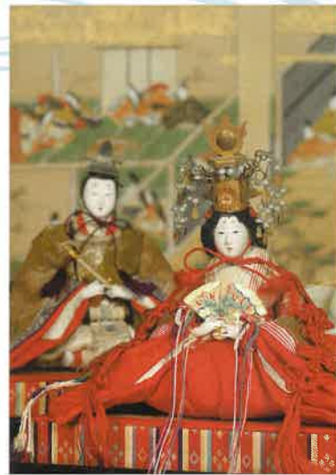
▶ 青山家所蔵の雛人形