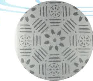
◀ 絵入り砂摺りガラス 明治期に長崎で作られた高価な板ガラス。板戸や障子しかなかった時代にとって「まさに文明開化の特徴」