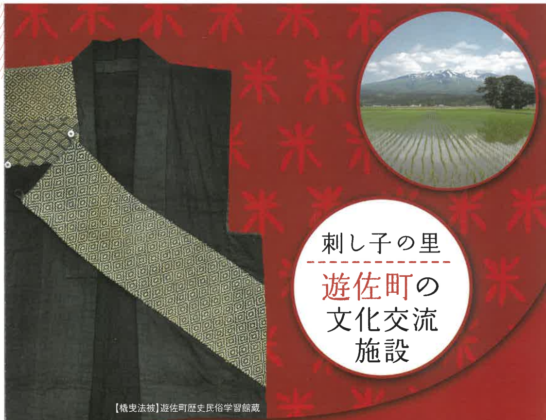
【機織法被】遊佐町歴史民俗学習館蔵